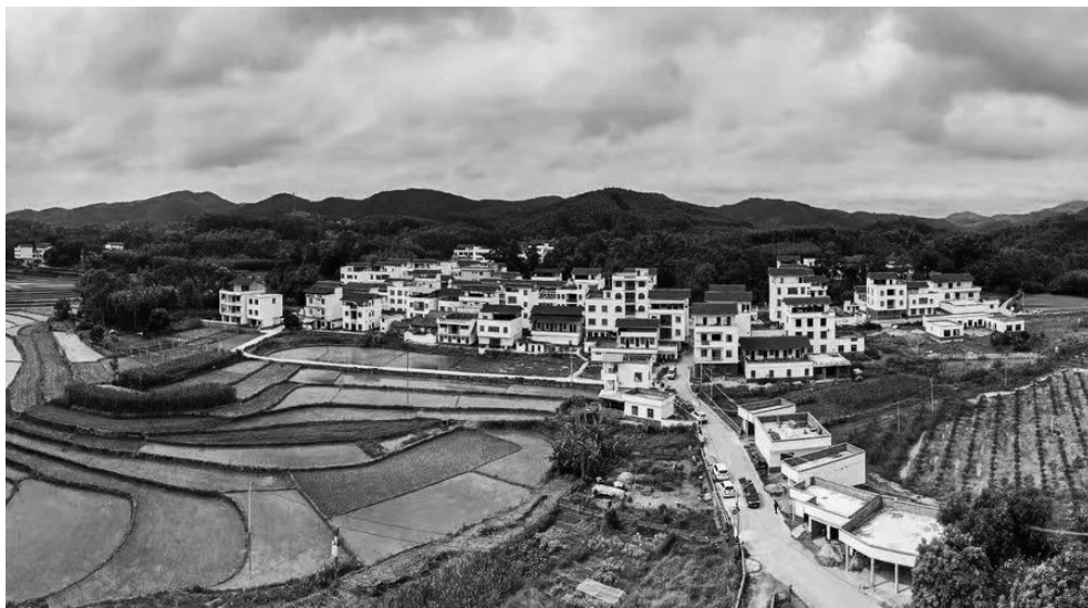
| 城乡连体共生是推进城乡融合发展的抓手

城乡连体共生，其实质就是以共生形态打造城乡共同体。按照功能分区定位，包括产业功能，区位优势功能，生活功能，文化功能，生态功能如城市农业、城市花园定位，通过以城带乡、以乡促城、城乡联动、城乡融合、城乡共生，突破现