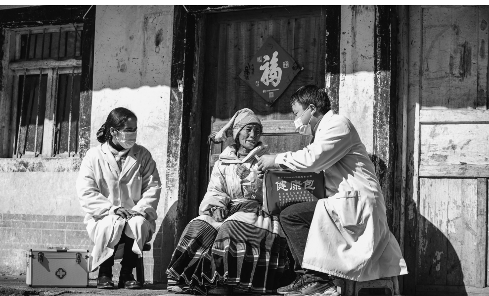
做好重点人群防护服务工作，保证农村疫情平稳过峰