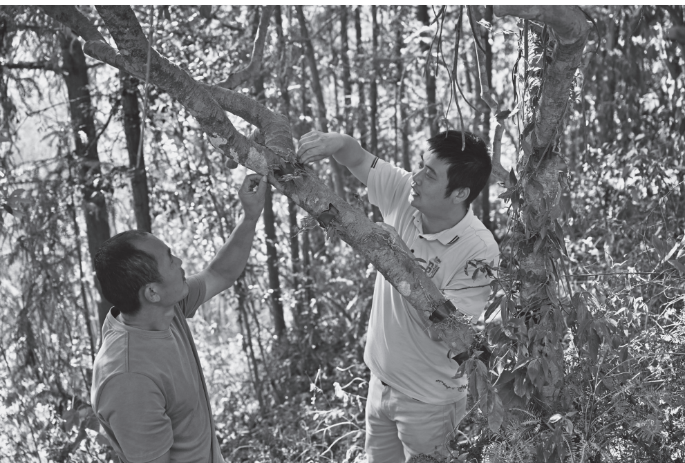
农村创业创新蔚然成风，持续为乡村振兴提供强劲动能