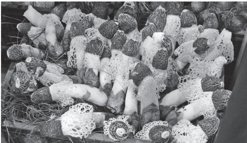
| 食用菌产业已成为安徽太和县乡村产业发展的重要抓手

托竹荪的液体菌种，解决了红托竹荪引种育种、跨区域栽培、周年式生产的技术难题，开创了红托竹荪工厂化生产的先例，破解了红托竹荪工厂化生产的关键技术，探索了一条“产加销带”全产业链的发展模式。安徽省百蕈现代农业科技有限公司经过三年的努力，获得发明专利和新型实用专利23项。培育出了“皖荪1号”“皖荪2号”“皖荪3号”三个菌株并拥有独立的自主知识产权。与韩国LG公司共同研发了