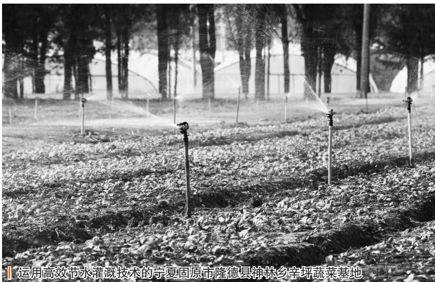
运用高效节水灌溉技术的宁夏固原市隆德县神林乡辛坪蔬菜基地

推进农业绿色高质量发展的重要支撑。近年来，中央生态环境保护督察对各地反馈问题中多次提到：地下水超采严重、违规调取黄河水、农业用水粗放、农业耗水量占比大、有效利用效率低、稻区面源污染突出等内容。大力发展节水灌溉，推