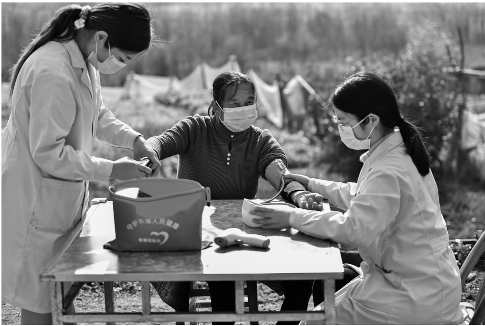
将医疗资源与医务工作者送下村去，团结打好农村疫情防控战

加紧缺，加之春运期间城乡之间人口的大规模流动，农村地区的疫情防控将是一场硬仗。各地各部门把对农村疫情防控重要性和紧迫性的认识化为实实在在的行动，把农村疫情防控作为要事急事来抓，做好拼全力、打硬仗的准备，调动各方面资源力量，努力确保农村疫情平稳过峰。