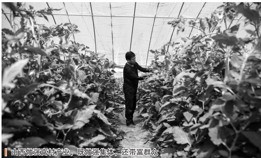
山西做强富村产业，既做强集体，还带富群众

“活”字赋能，活化“三资”添动力。推动农村要素资源市场化配置，让沉睡的资产资源动起来，真正实现农民财产权利。要“活”化集体“三资”。盘活用好农村集体资产资源，探索通过投资入股等方式设立公司法人、建立市场运营平台等方式开展经营活动。加快省级农村产权流转交易平台建设，把农村产权交易全部放到平台上，推动农