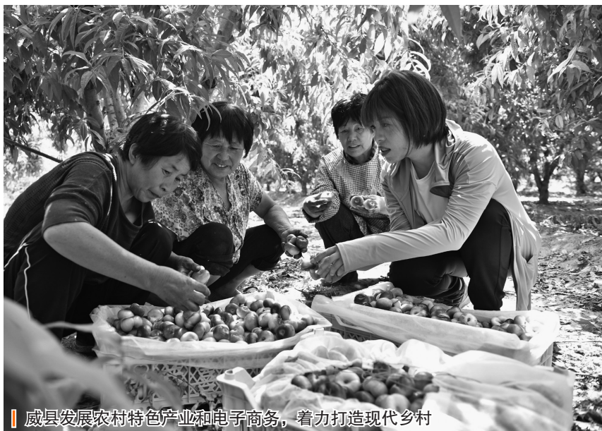
威县发展农村特色产业和电子商务，着力打造现代乡村

习近平总书记强调，要锚定建设农业强国目标，科学谋划和推进三农工作，加强顶层设计，制定加快建设农业强国规划。威县历史上曾长期落后，农业一棉独大，工业近乎空白，是远近闻名的“大破穷”县，2012年被认定为国家扶贫开发工作重点县，2018年9月脱贫摘帽。聚焦建设农业强县，威县明确了“一区三带五主导、七个特色带全域”的产业规划。