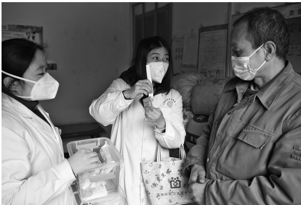
保障医疗物资供应，确保农村居民用得上还会用

日前，由国务院联防联控机制和中央农村工作领导小组联合印发的《加强当前农村地区新型冠状病毒感染疫情防控工作方案》明确要求，“五级书记”要像抓脱贫攻坚一样抓农村地区的疫情防控。要建立包保制度，省统筹、市调度、县乡村抓落实，层层压实责任。基层党