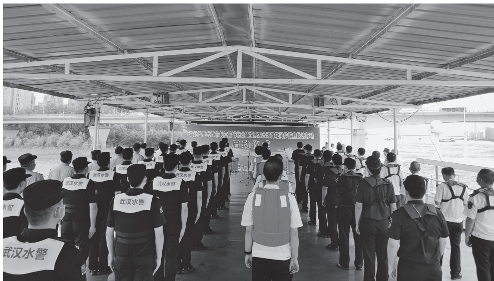
湖北武汉市以“十年禁渔”为抓手，积极探索大江大湖渔政监管新路径

批、落实社保兜底保障一批，全市1151名退捕渔民中有就业能力和就业愿望的785人实现了转产就业；设立保洁保安、园林绿化等公益岗位165个，为一些年龄大、文化低的特殊退捕渔民量身“造饭碗”，发挥退捕渔民熟悉鱼情、水情的优势，选聘62人成为协助巡护员；建立了包保联系、定期回访、常态帮扶和督促检查四项机制，对退捕渔民实行结对帮扶、动态监测，确保退得出、稳得住。与此同时，准确把握“十年禁渔”中蕴含的潜在需求和可能