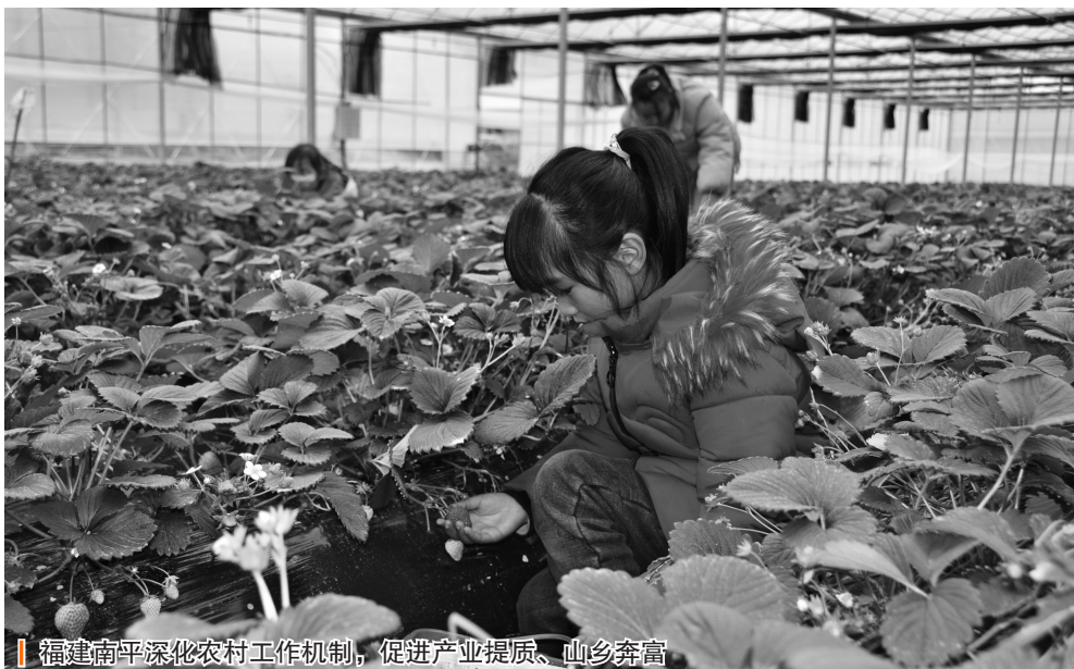
福建南平深化农村工作机制，促进产业提质、山乡奔富

“高位嫁接”，构筑城乡统筹的制度管道。把选派党员干部驻村任职作为主抓手，1999年以来，从党政机关、企事业单位、科研院所等累计选派8批3326名驻村任职党员干部、11批1.3万名科技特派员、6批541名流通助理驻村服务，并先后创新选派金融助理、乡村振兴