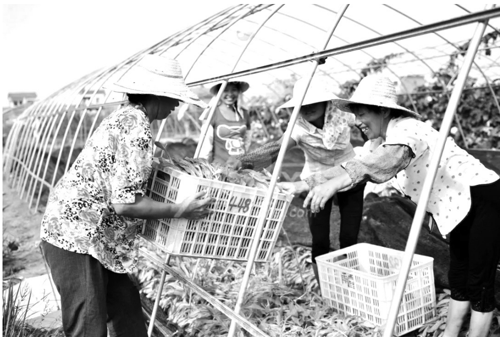
| 农民专业合作社、农民专业合作社联合社都是农业农村领域重要的市场主体

明确一般登记事项。农民合作社的一般登记事项有六项,即名称、主体类型、经营范围、住所或者主要经营场所、出资额、法定代表人