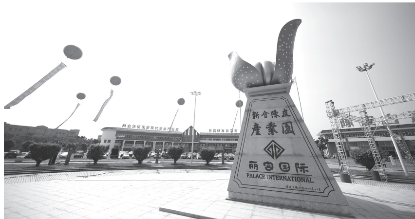
新会陈皮国家现代农业产业园“大加工”代表性园区——丽宫研发加工园