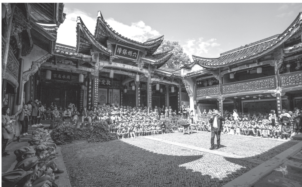
汪氏宗祠内研学活动

间文艺团队，并特地聘请了相关老师辅导教艺。好多村里打扑克、搓麻将的妇女和青年人，都纷纷进了文化团队，他们在亲身参与文艺活动的同时，增长了见识，尝到了乐趣，受到了熏陶，审美情趣、思想觉悟得到不同程度的提升。传统的民俗文化节被赋予了具有时代特色的文化内涵后，受到了村民和各界朋友