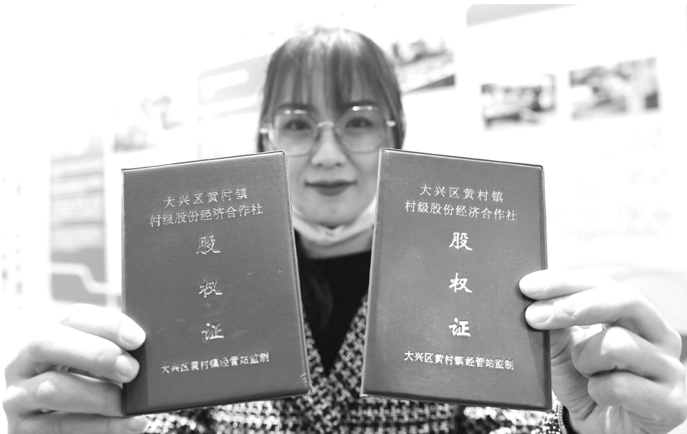
农民合作社的登记对于确立经营信誉、保障交易安全具有重要意义

设立歇业制度。 农民合作社在发展过程当中，可能遇到来自自然、市场等各种不可预料的风险，需要进一步完善帮扶制度，帮助农民合作社渡过难关，提升发展空间。《条例》设立了歇业制度，因自然灾害、事故灾难、公共卫生事件、社会安全事件等原因造成经营困难的，农民合作社等市场主体可以自主决定在一定时期内歇业。为构建和谐劳动关系，应当在歇业前与职工依法协商劳动关系处理等有关事项，并向登记机关办理备案。歇业期限最长不得超过3年。农民合作社等市场主体在歇业期间开展经营活动的，视为恢复营业，须通过国家企业信用信息公示系统向社会公示。歇业制度是针对市场主体个性化的情况而设，这一制度的推行将允许农民合作社等市场主体适度休眠，降低农民合作社等市场主体在特殊时期的经营成本。