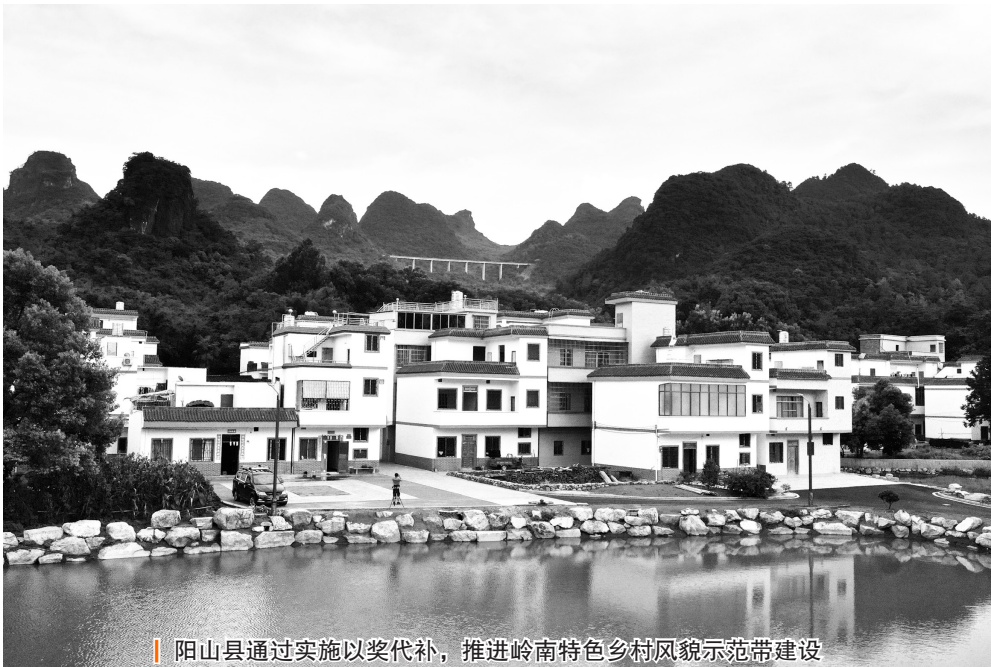
阳山县通过实施以奖代补，推进岭南特色乡村风貌示范带建设

创新“334”引导约束机制。以制度形式规定各项乡村建设项目的前期准备工作和后续管护要求，明确村小组（村民）的责任主体地位，引导约束农民参与建设的责任感和义务感。一是实行“门前三包”制度。通过宣传动员、召开村民代表大会、入户谈话等，把乡村建设规划、“门前三包”等以村规民约的形式固定下来，明确村民责任和义务。