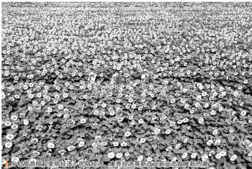
乡村旅游掀起美丽经济、民宿经济、康养经济等新产业新业态发展新热潮

农民是党推动建设改革的强大主体。新中国成立初期，国家百废待兴，农民坚决扛起了国家前行的千钧重担，广大农民战天斗地，靠铁锹泥筐、肩挑手拉修筑起数万水利设施，直到今天还在发挥重要作用。改革开放时期，农民的积极性、主动性、创造性得到充分释放，