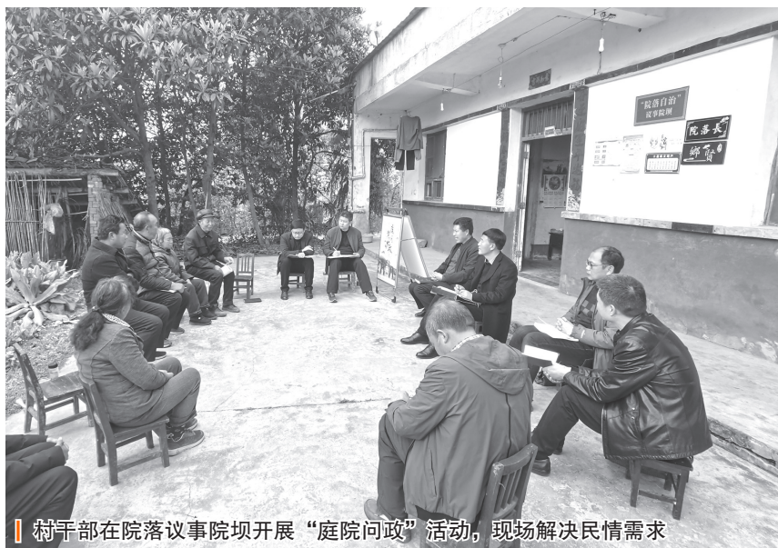
村干部在院落议事院坝开展“庭院问政”活动,现场解决民情需求

以“院落领袖”为引擎,把群众“看戏”转变为“唱戏”。在传播学中,意见领袖活跃于人际传播网络中,经常为他人提供信息、观点或建议,并对他人施加个人影响。为发挥院落文化在倡树文明新风、凝聚精神力量方面的柔性作用,该村从新风新俗倡导、