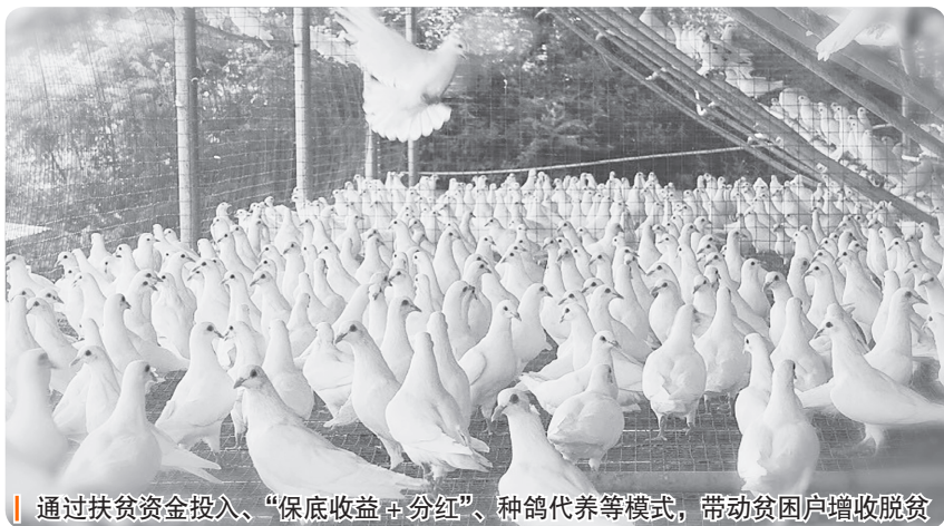
通过扶贫资金投入、“保底收益+分红”、种鸽代养等模式,带动贫困户增收脱贫

打通链条促脱贫。 一是打通技术链。组织52名农业专家建立8个农业产业扶贫工作组对接8个县(市、区),通过实用技能培训、产业巡回指导、微信平台讲解等不同形式,提供技术服务。二是打通销售链。依托互联网商城等平台,推动批发市场、电商企业、大型超市等市场主体与扶贫产业基地、相对贫困村建立长期稳定的产销关系,实现贫困村农产品进市场、进商超。借助粤港澳大湾区“菜篮子”梅州配送中心和21个生产基地,开展以购代捐和消费扶贫“五进”等活动。建成7个县域电子商务运营中心、865个镇村电商服务站,实现省定贫困村全覆盖。5个县(市)获评国家级电子商务进农村综合示范县。🍎