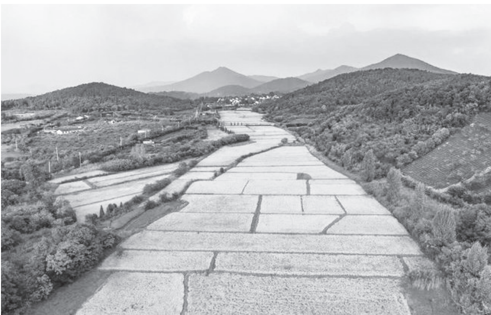
| 句容市茅山镇何庄村的高标准农田项目现场