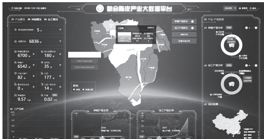
新会陈皮产业大数据平台

实施“大服务”，保障全方位发展“加速度”。以大数据平台为支撑，整合政府、协会和社会资源，不断完善服务体系，建成新会陈皮公共服务中心，提供管理、政策、金融、科技、数据、电商、协会、农资农技等8大服务，全方位为陈皮产业发展保驾护航；抢抓农业“新基建”发展新机遇，以“品牌+宣传+短视频+直播”等形式推动新会陈皮线上线下融合发展，开展电商人才培养线上直播课程，有效帮助新会陈皮产业增强发展竞争力、拓宽全渠道销路。📺