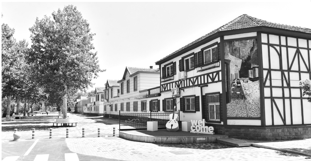
得利斯村民别墅区