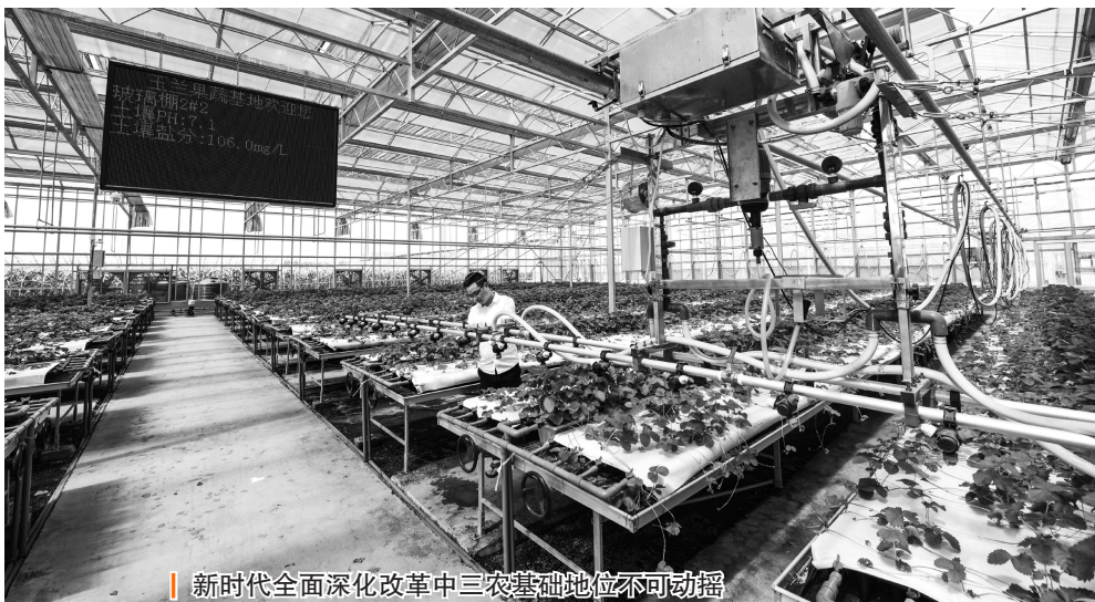
新时代全面深化改革中三农基础地位不可动摇

全面厘清本质建设的目标路径。按照“一年打基础、两年抓深化、三年大提升”的要求，提升政治能力、思辨能力、创新能力、执行能力等“四