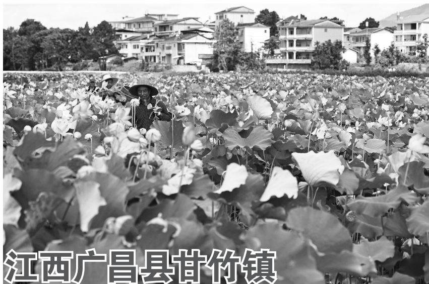
江西广昌县甘竹镇